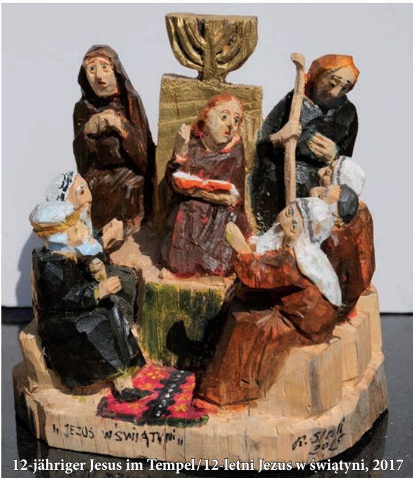
12-jähriger Jesus im Tempel / 12-letni Jezus w świątyni, 2017