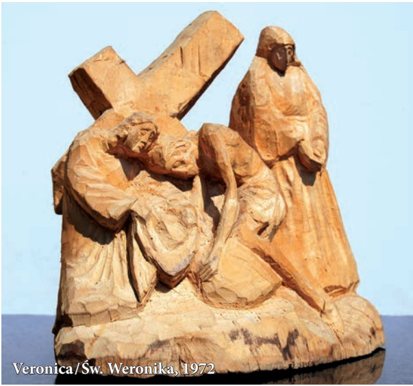
Veronica / Sw. Weronika, 1972