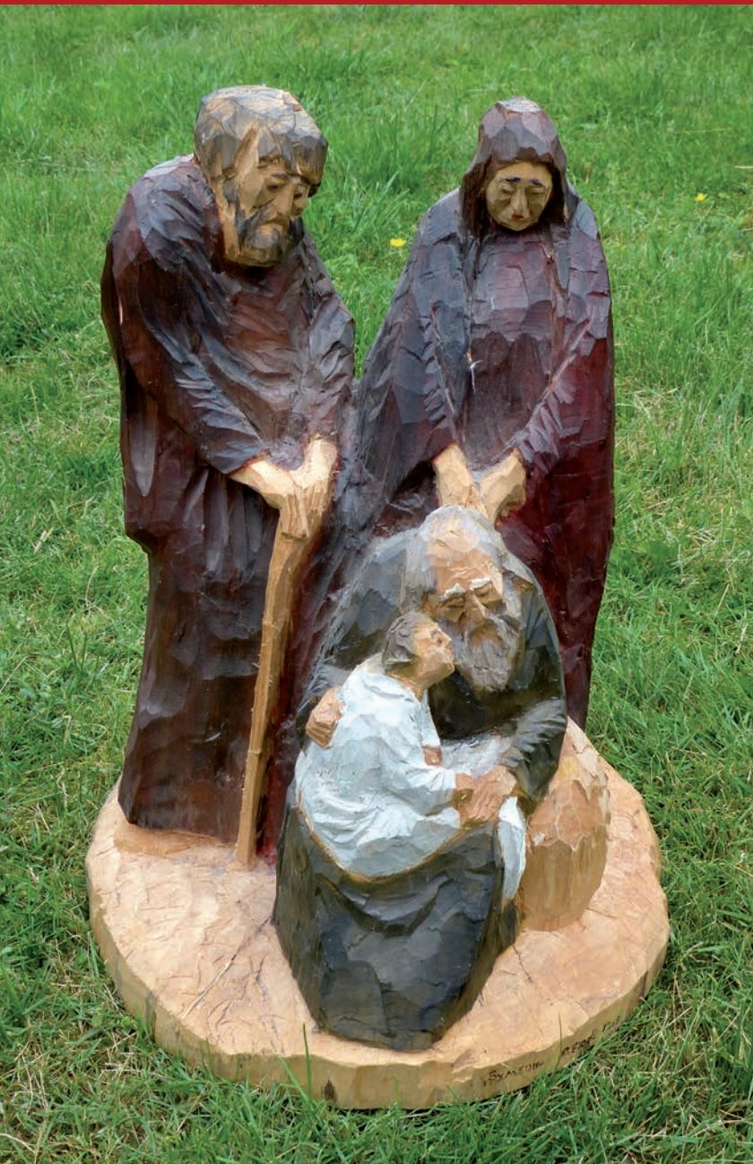
Jesu Beschneidung und Darstellung im Tempel - Simeon Obrzezanie i ofiarowanie Jezusa w świątyni - Symeon